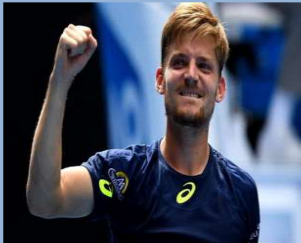
Давид Гоффен (Бельгия)

15-я ракетка мира, финалист Открытого чемпионата США