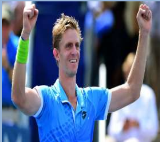
Кевин Андерсон (ЮАР)

15-я ракетка мира, финалист Открытого чемпионата США