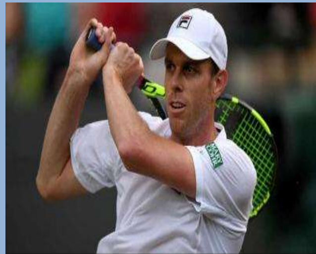
Сэм Куэрри (США)

полуфиналист Открытого чемпионата США, 10-я ракетка мира, четвертьфиналист Ролан Гаррос