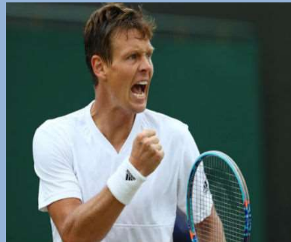
Томаш Бердых (Чехия)

12-я ракетка мира, четвертьфиналист Открытого чемпионата Австралии