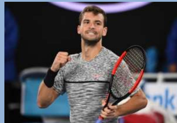
Григор Димитров (Болгария)

седьмая ракетка мира, полуфиналист Ролан Гаррос 2017, финалист Мастерса в Мадриде, победитель турнира АТР-500 в Рио-де-Жанейро