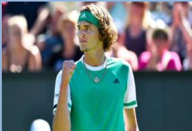
Александр Зверев (Германия)

четвертая ракетка мира, победитель 2 турниров Мастерс в этом году (Рим и Торонто)