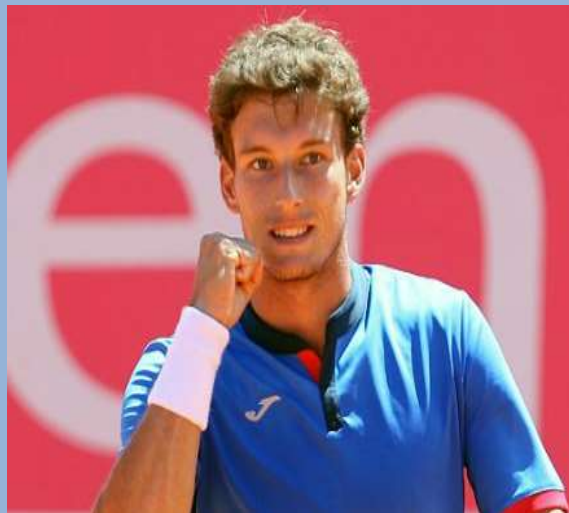
Пабло Кареньо-Буста (Испания)

пятая ракетка мира, финалист Уимблдона-2017, чемпион US Open 2014