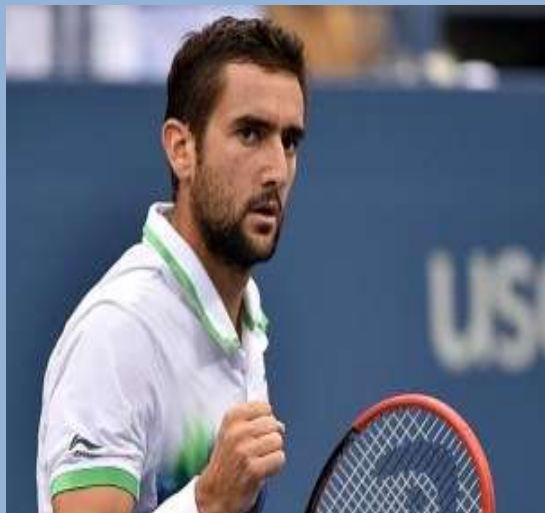
Марин Чилич (Хорватия)

пятая ракетка мира, финалист Уимблдона-2017, чемпион US Open 2014