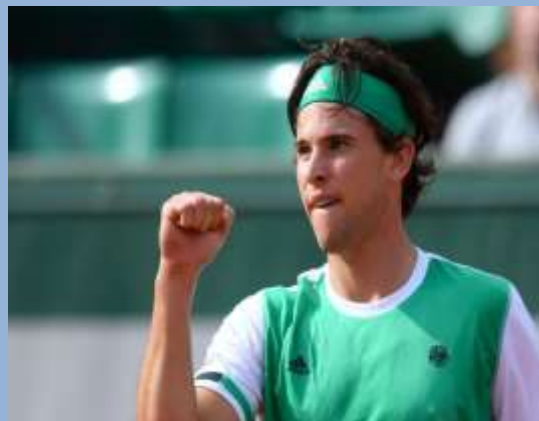
Доминик Тим (Австрия)

четвертая ракетка мира, победитель 2 турниров Мастерс в этом году (Рим и Торонто)