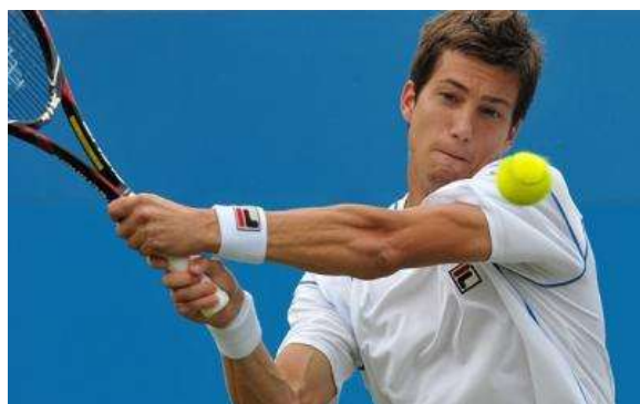
Эрнесто Эскобедо (США)