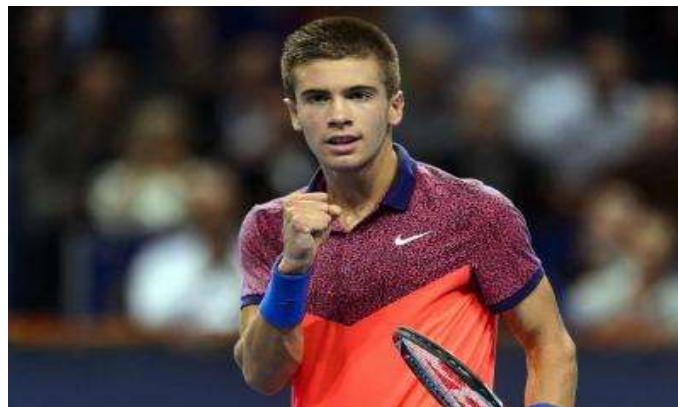
Борна Чорич (Хорватия) 55 ракетка мира