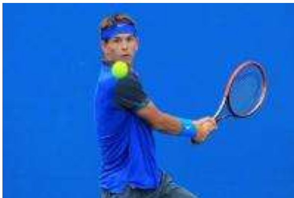
Джаред Дональдсон (США)