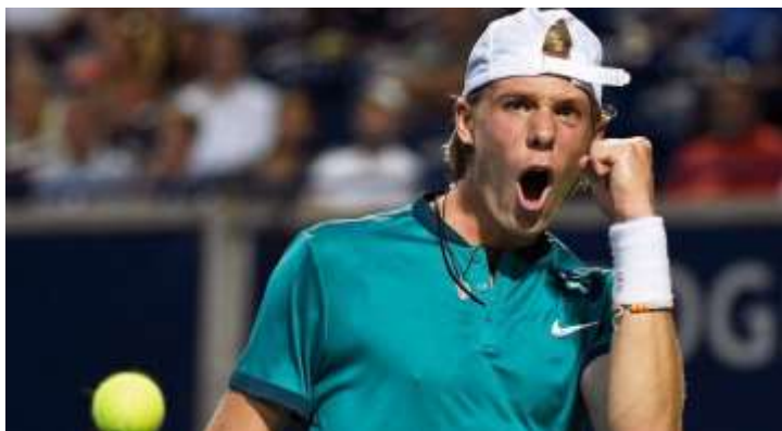
Денис Шаповалов (Канада) 50 ракетка мира