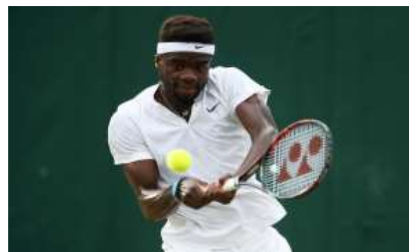
Фрэнсис Тиафо (США)