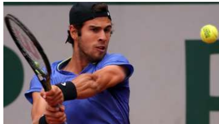
Карен Хачанов (Россия) 40 ракетка мира