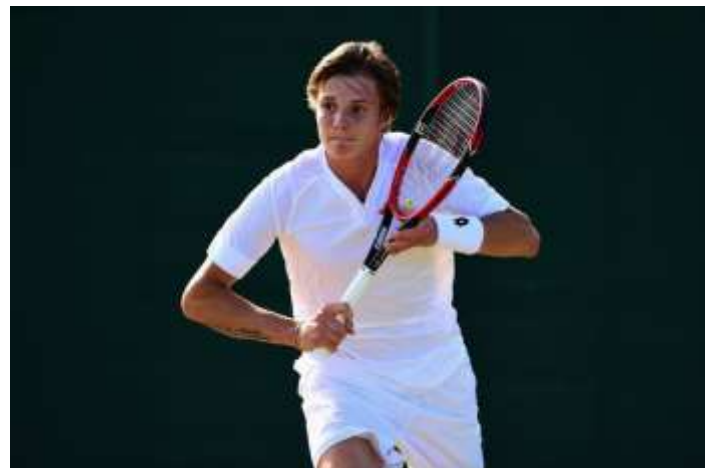
Александр Бублик (Казахстан) 100 ракетка мира