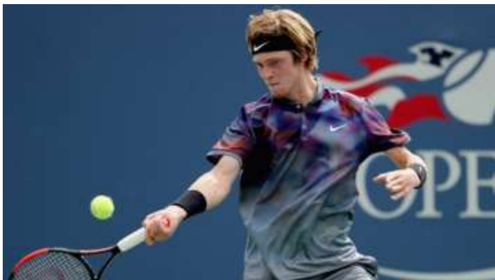
Андрей Рублев (Россия) 35 ракетка мира