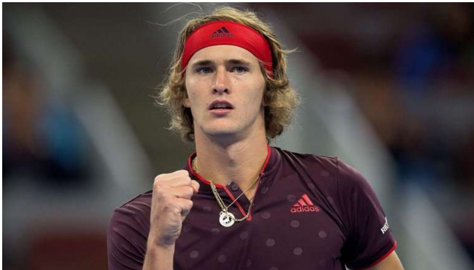
Александр Зверев (Германия) 4 ракетка мира