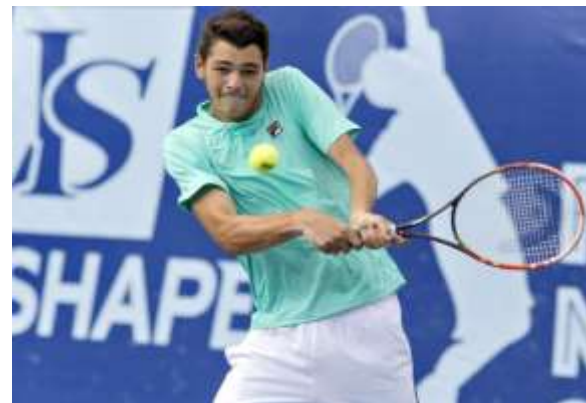
Тейлор Фриц (США)