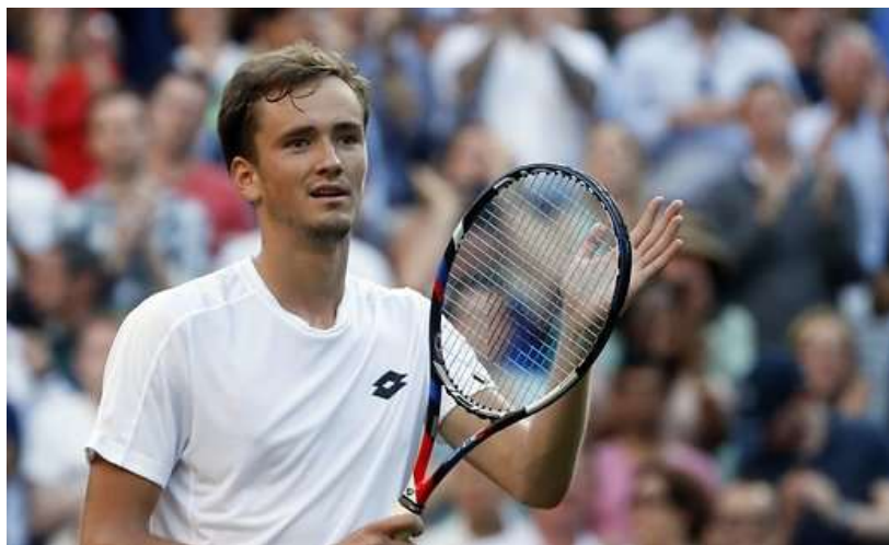
Даниил Медведев (Россия) 64 ракетка мира