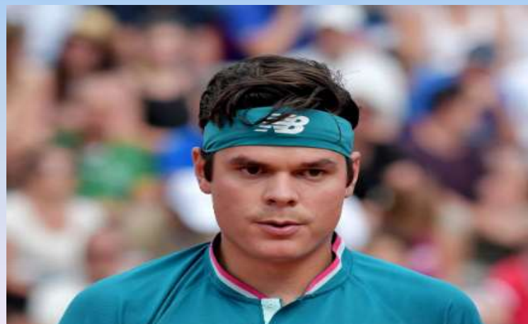
Милош Раонич (Канада)