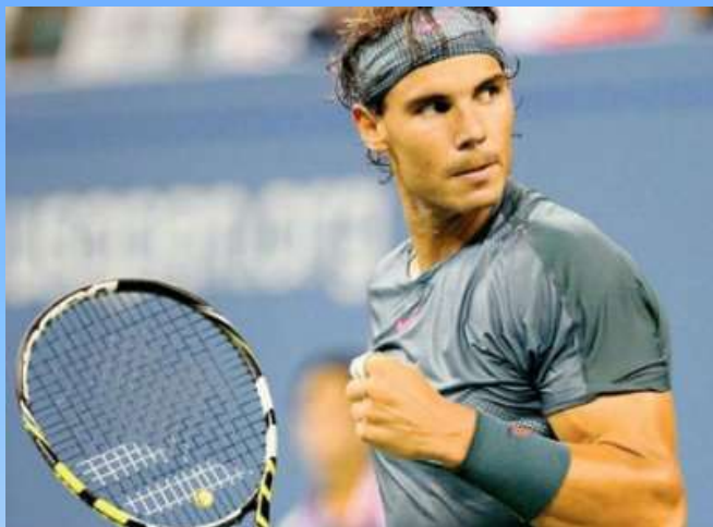
Рафаэль Надаль (Испания)