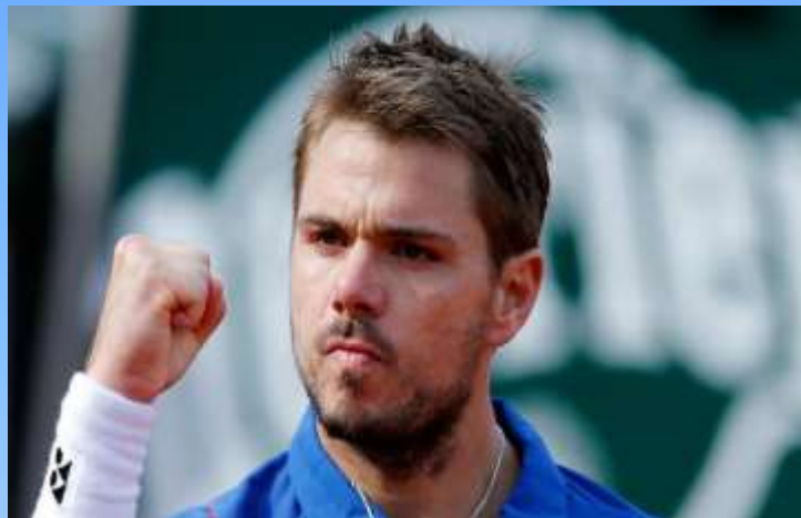
Стэн Вавринка (Швейцария)