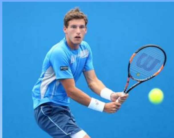
Пабло Карреньо-Буста (Испания)