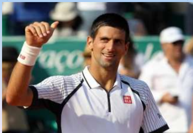
Новак Джокович (Сербия)