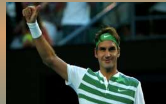
Роджер Федерер (Швейцария)