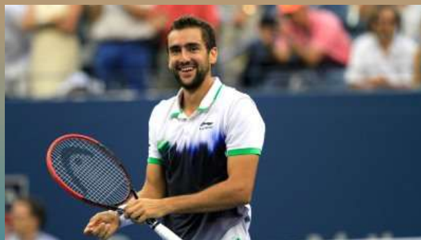
Марин Чилич (Хорватия)