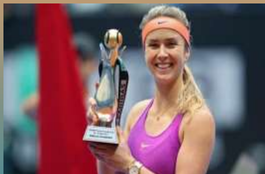
Элина Свитолина (Украина)