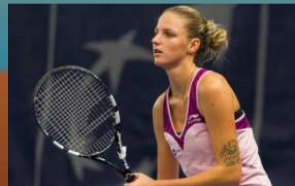
Каролина Плишкова (Чехия)