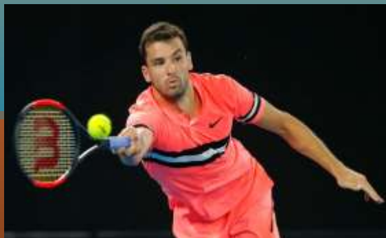
Григор Димитров (Болгария)