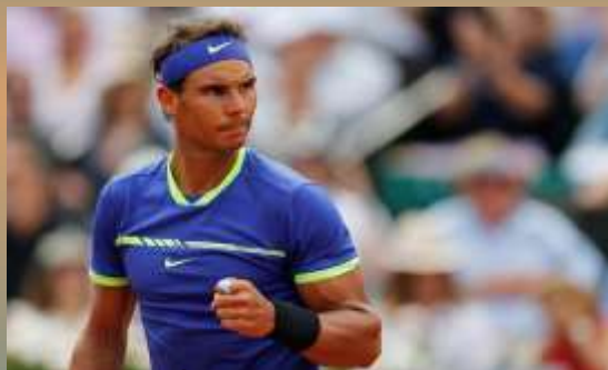
Рафаэль Надаль (Испания)