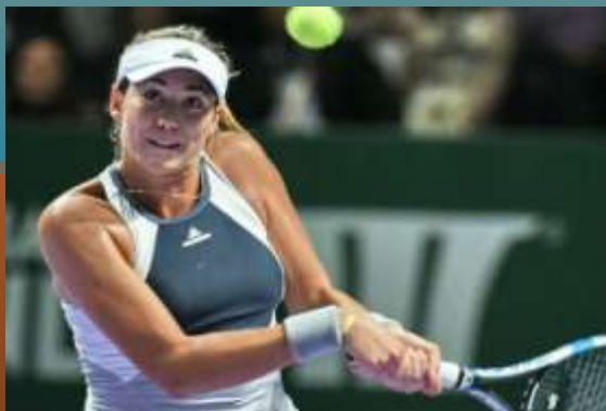
Гарбинье Мугуруса (Испания)