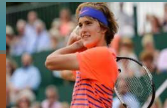
Александр Зверев (Германия)