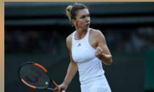
Симона Халеп (Румыния)