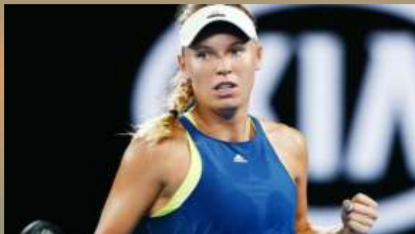
Каролина Возняцки (Дания)